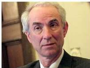
Minister Gerd Leers