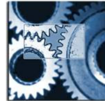
Controle: -kwaliteit -risico's