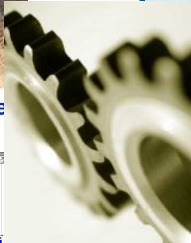
Kennis business en product