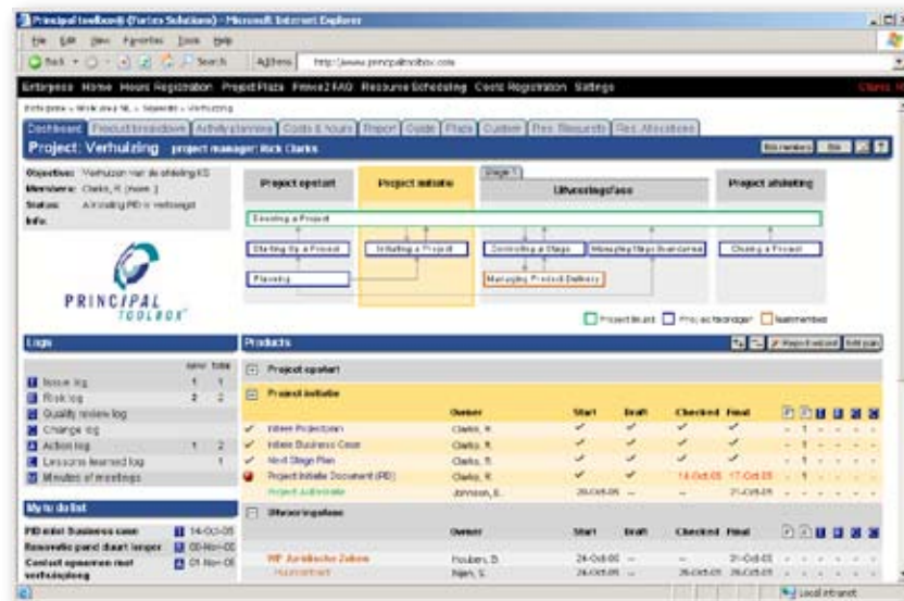
Screenshot van project dashboard in de Principal Toolbox